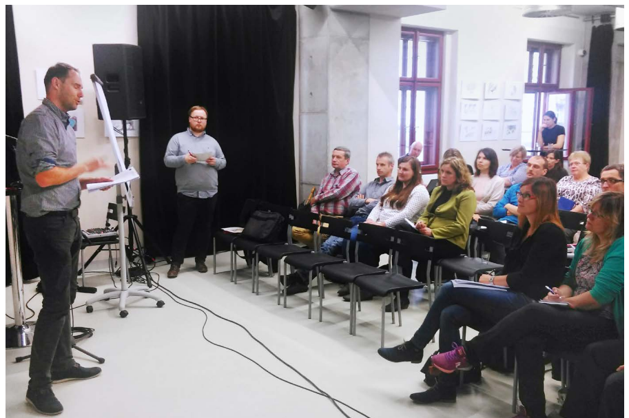
Účastníci kulatého stolu v Plzeňském kraji