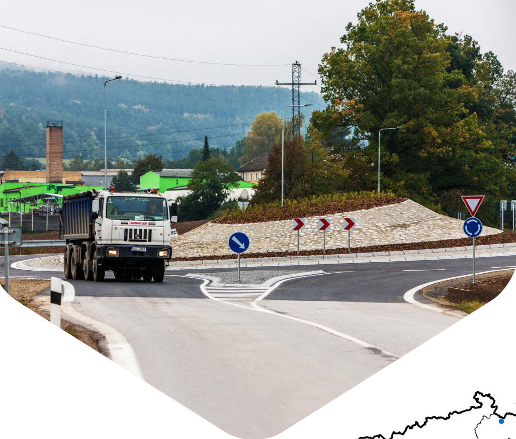
Kruhový objezd v Husinci, Jihočeský kraj

regionální silniční infrastruktury navazující na síť TEN-T". Žadatelé mohou žádosti o podporu podávat od 20. března 2017 do 21. prosince 2018. Více informací naleznete na stránkách programu .