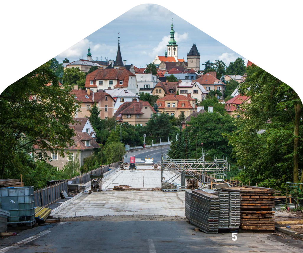
Rekonstrukce Švehlova mostu v Táboře, Jihočeský kraj

Výzva č. 70 „Vybrané úseky silnic II. a III. třídy - II“ je vyhlášena ve specifickém cíli 1.1 IROP „Zvýšení regionální mobility prostřednictvím modernizace a rozvoje sítí